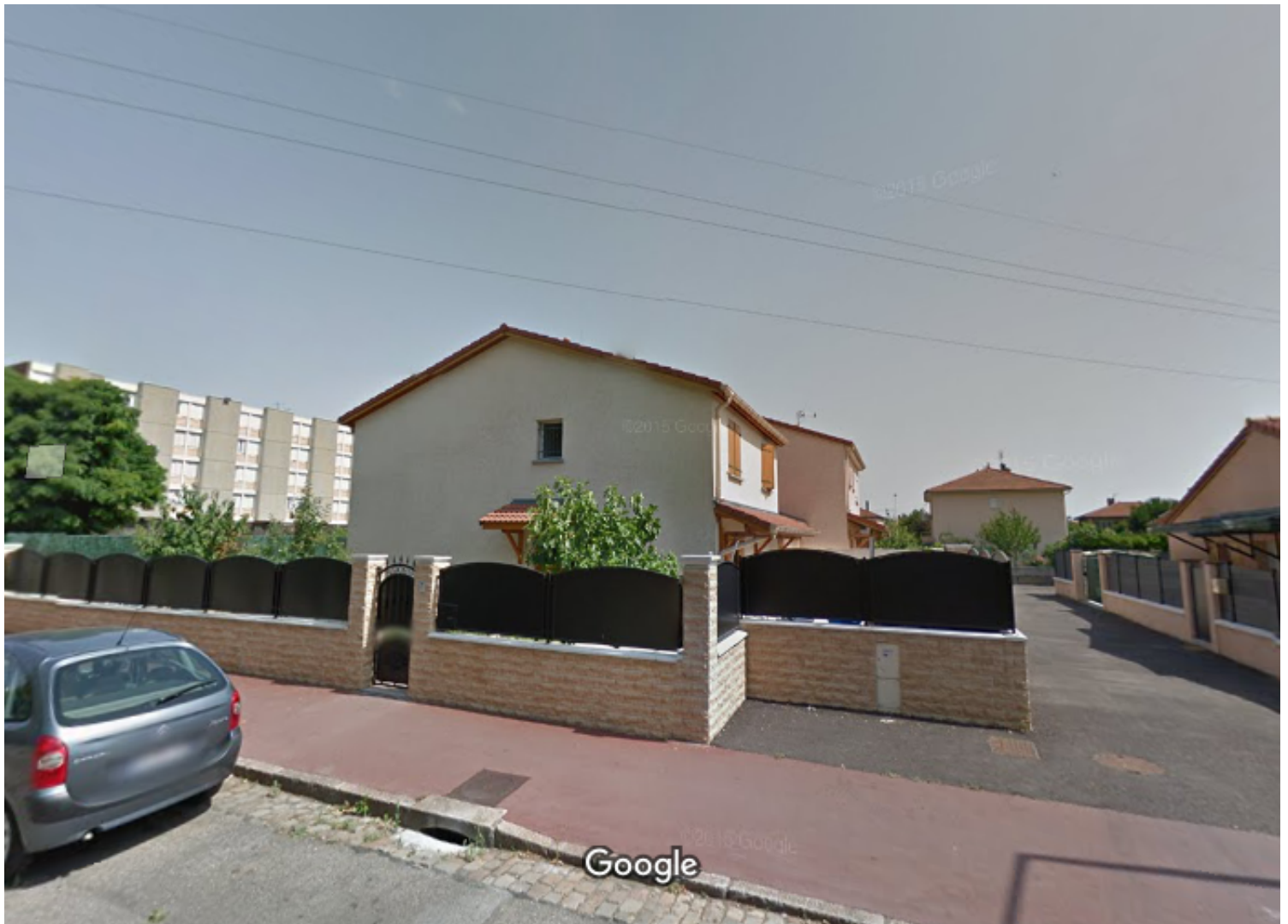
Date de l'image : juil. 2015